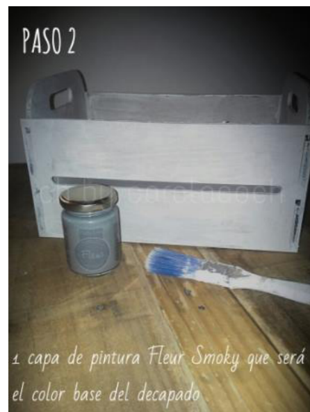
1 capa de pintura Fleur Smoky que será el color base del decapado

Aplicamos una capa de pintura Fleur color Smoky y dejamos secar completamente. Una vez seca, retocamos para dejar la caja bien cubierta con esta pintura.