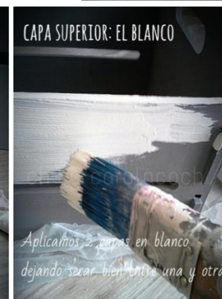
Aplicamos 2 capas en blanco dejando secar bien entre una y otra