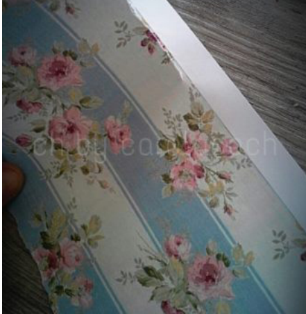
Imagen impresa en láser para realizar transferencia