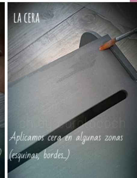
Aplicamos cera en algunas zonas (esquinas, bordes...)