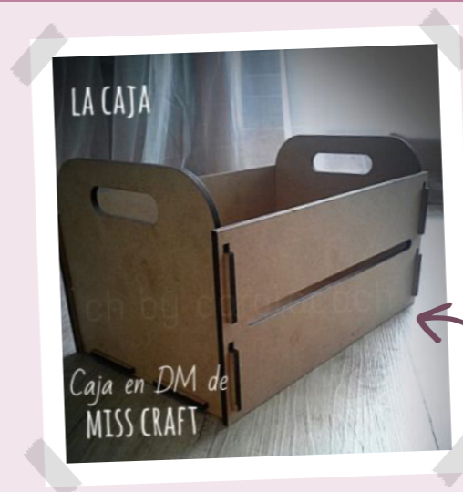
Caja en DM de MISS CRAFT

Montamos la Caja DM de Miss Craft. Ya viene con todos los troquelados realizados para su fácil montaje.