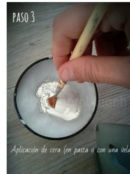
Aplicación de cera (en pasta o con una vela)

Con un pincel fino aplicamos cera Fleur en bordes, cantos y en algunas zonas centrales de la caja.