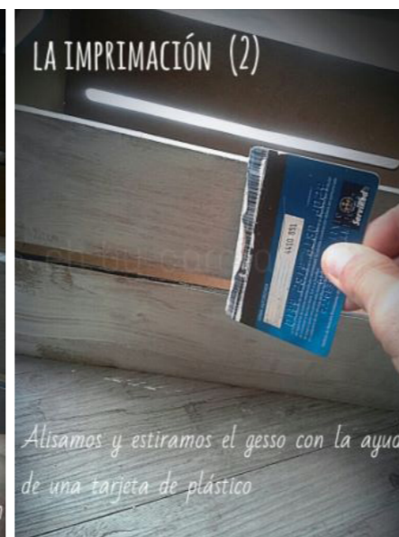
Alisamos y estiramos el gesso con la ayuda de una tarjeta de plástico

Aplicamos una capa de pintura Fleur color Smoky y dejamos secar completamente. Una vez seca, retocamos para dejar la caja bien cubierta con esta pintura.