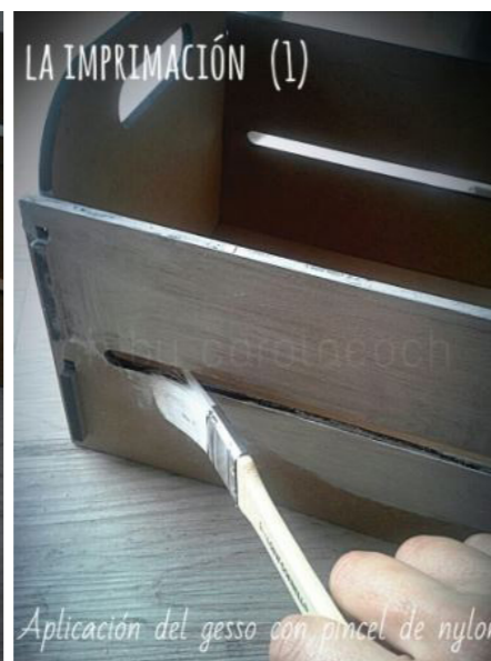
Aplicación del gesso con pincel de nylon