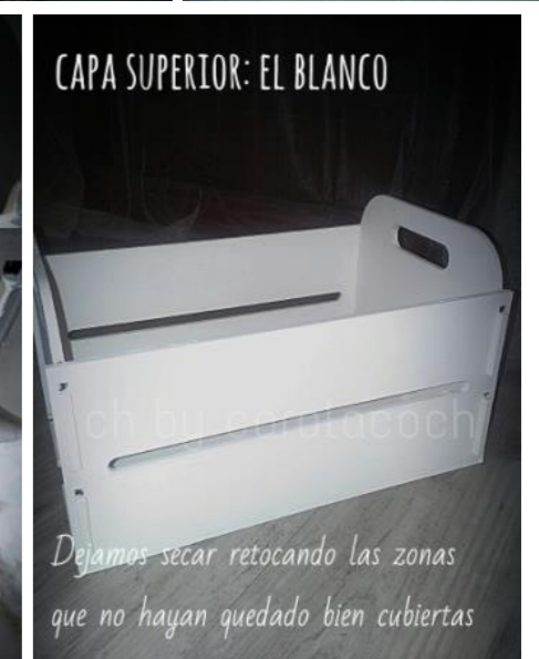
Dejamos secar retocando las zonas que no hayan quedado bien cubiertas

Aplicamos el segundo color para dar el efecto decapado. En este caso hemos escogido Sugar de Fleur. Aplicamos una primera capa y dejamos secar. Una vez seca, aplicamos una segunda capa para que quede totalmente cubierta.