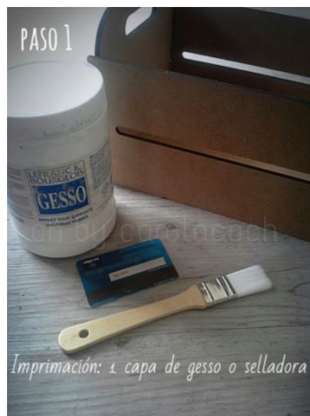
Imprimación: 1 capa de gesso o selladora

Aplicamos una capa fina de gesso con una paletina y alisamos con la ayuda de una tarjeta de plástico para dar una capa uniforme. Esta acción nos protegerá la caja de humedades, nos tapará el poro y nos ayudará a la hora de aplicar la pintura.