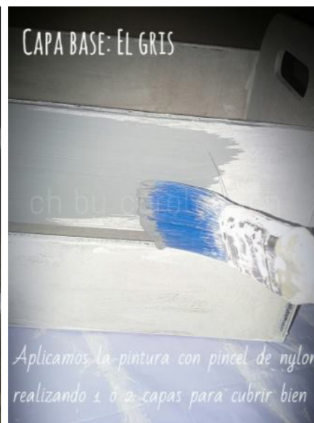
Aplicamos la pintura con pincel de nylon realizando 1 ó 2 capas para cubrir bien