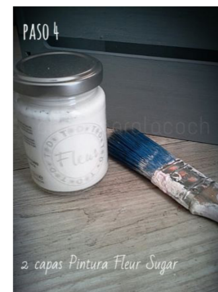
2 capas Pintura Fleur Sugar