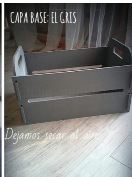
Dejamos secar al aire